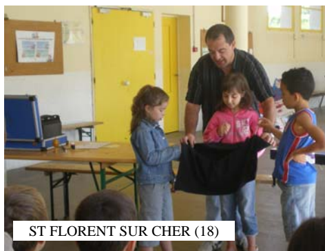
ST FLORENT SUR CHER (18)

Initiation à la magie destinée aux enfants présentée sous forme d'atelier ludique, adaptable à tous types de lieux et de structures. L'Atelier Magique permet d'offrir aux enfants une première approche de cet art, au travers de quelques tours qu'ils pourront ensuite réaliser seuls .