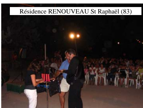
Résidence RENOUVEAU St Raphaël (83)

● Les enfants vont ensuite répéter sur scène leur tour de manière succincte (sans la sono) afin de se familiariser avec la scène. Selon le nombre d'enfants, il n'est pas toujours évident que tous passent sur scène. En effet, il faut pour passer 30 enfants sur scène environ 40 à 45 minutes dans des conditions de spectacle, et ce sans lasser le public... Pour des groupes supérieurs à 20 enfants, il faut envisager une autre solution (soit créer un « jury » façon Star Ac' pour déterminer un nombre d'enfants limité, soit organiser 2 représentations. A étudier avec vous au cas par cas)