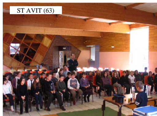
ST AVIT (63)

L'Atelier Magique permet aux enfants de développer minutie, attention, patience, calcul mental, et, grâce au spectacle de fin de stage, leur permet de s'exprimer en public. Ateliers de 4h30 (répartis sur 1 ou 3 journées), pour des groupes de 10 à 20 enfants âgés de 7 à 12 ans .