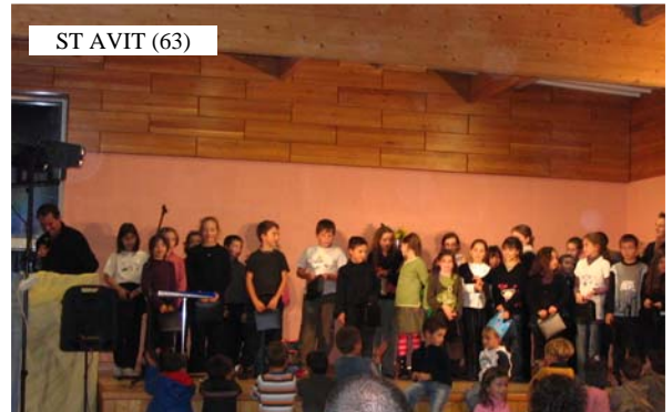
ST AVIT (63)

● Numéro parlé de type cabaret et humoristique avec la participation très active du public (adultes et enfants). A chaque tour, le public va penser soit qu'il a compris le truc, soit que l'artiste s'est trompé...avant de constater qu'il n'a pas saisi le truc, et que bien sur l'artiste ne s'est pas trompé ! Participation directe jusqu'à 25 personnes sur scène et dans la salle. Tours de prédiction surprenants, et grands classiques du cabaret.