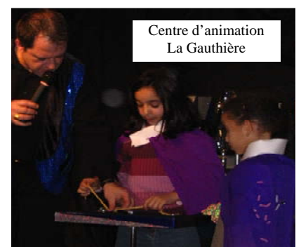
Centre d'animation La Gauthière