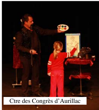
Centre des Congrès d'Aurillac