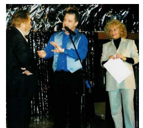
Casino de La Baule