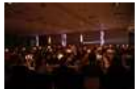
Soirée de gala Lion's Club