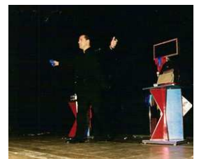
Opéra de Vichy